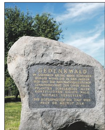
Der Gedenkstein aus Granit

Durch die Umgestaltung wurde die Zugänglichkeit zum Wald verbessert. Das Konzept wurde gemeinsam vom Bezirk, der Israelitischen Kultusgemeinde und dem Stadtteilmanagement Seestadt Aspern ausgearbeitet. Der Historiker Peter Pirker gestaltete zudem 18 Tafeln auf einem der neuen Holzstege, die über die Ge-